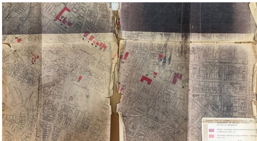
Figura 3: Proposta final de tombamento [indicando os 24 imóveis anteriormente citados e seus níveis de proteção] realizado pelo DPH.

Todavia, na mesma minuta, acima mencionada, sete obras foram classificadas com o nível de proteção P1, ou seja, “bem de excepcional valor histórico-arquitetônico, cuja preservação deve ser integral, tanto externa quanto internamente”. A maioria, no entanto, 17 obras, recebeu o nível de proteção P2, que estabelece que “a preservação limita-se à parte externa das edificações” (Figura 3). Mesmo assim, o parecer exigia a preservação de “arborização, ajardinamentos, canteiros, passeios, elementos decorativos, edículas, muros, gradis, portões, etc.” (São Paulo, 1992a, p. 92).