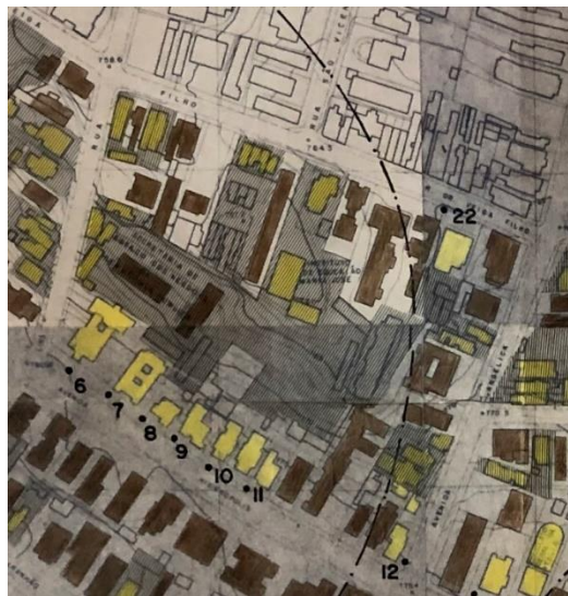
Figura 2: Pormenor do mapa da “Proposta de preservação de imóveis no núcleo original do Bairro de Higienópolis” (Figura 1), centrado no quarteirão onde seria construído o Shopping Higienópolis, inaugurado em 1999.

Legenda da Figura 2: idem à da Figura 1, destacando o tracejado vertical, que indica áreas com potencial de verticalização.