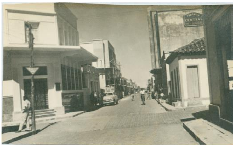
Figura 3: Rua Barão do Rio Branco, na década de 1950, com a presença do Cine-Teatro Hollywood; à direita.

Morrinhos, na década de 1950, já não era mais a pequena vila de casas rústicas e esparsas (Oliveira, 2019). A cidade passou, no decorrer do século XX, por transformações urbanas influenciadas pelas notícias que chegavam sobre a moderna e nova capital do estado, Goiânia, incluindo as transformações nas fachadas das residências da Rua Barão do Rio Branco (Figura 3), rua principal da cidade, e a construção do Cine-Teatro Hollywood, em 1949, por Jorge Félix de Souza, em estilo art déco, também na mesma rua.