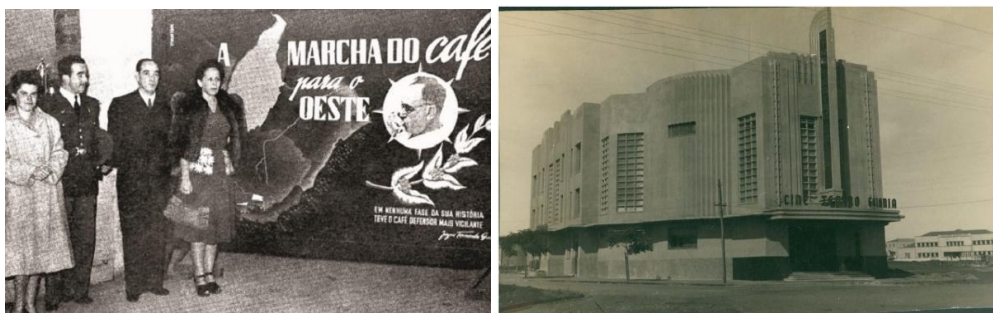
Figura 2a e 2b: À esquerda, fotografia feita durante as solenidades do Batismo Cultural de Goiânia, em 1942; à direita, fotografia do Cine-Teatro Goiânia, atual Teatro Goiânia, também em 1942.

Fonte: Acervo do IFG 1 e acervo do IBGE 2 , respectivamente.