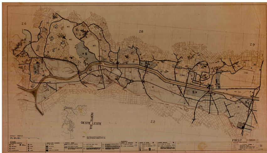
Figura 3: Foto original que exemplifica um dos 25 setores desenvolvidos para todo o município.